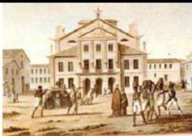
Fachada do Real Teatro São João