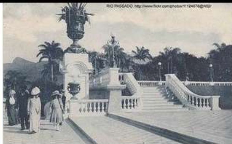
Quinta da Boa Vista