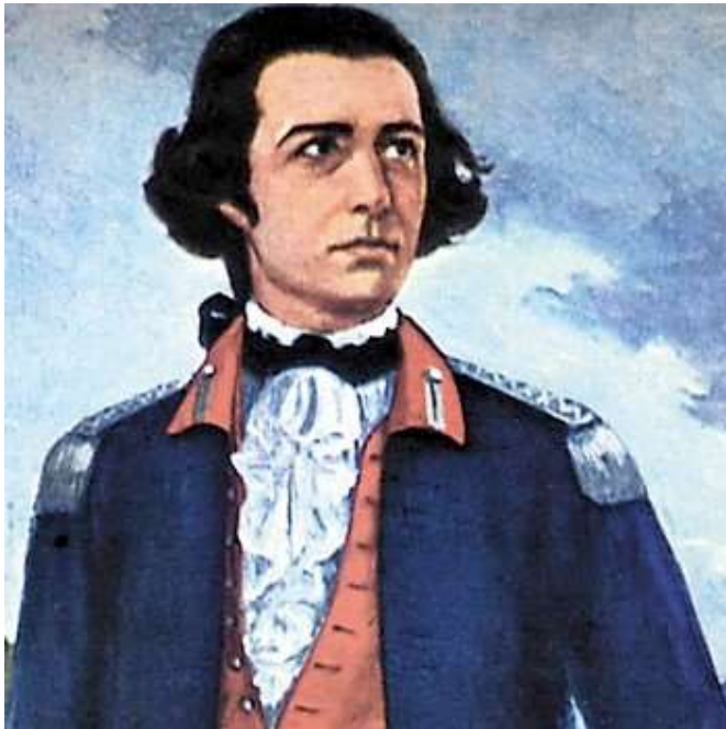
O Alferes da Monarquia