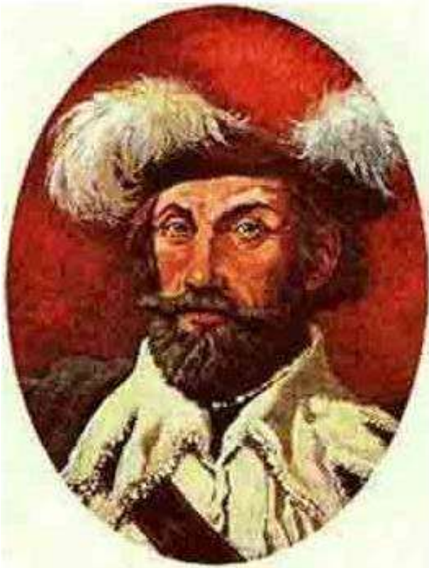
Tomé de Souza