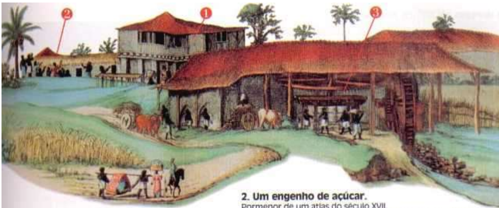
2. Um engenho de açúcar. Pormenor de um atlas do século XVII. 1 - Casa-grande, morada do senhor do engenho e da sua família. 2 - Senzala, habitações dos escravos. 3 - Casa do engenho, instalações onde se encontram os aparelhos destinados ao fabrico do açúcar.