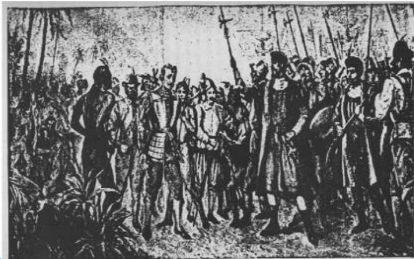
Expulsão dos franceses do Maranhão em 1615 (Quadro de Armando Viana)