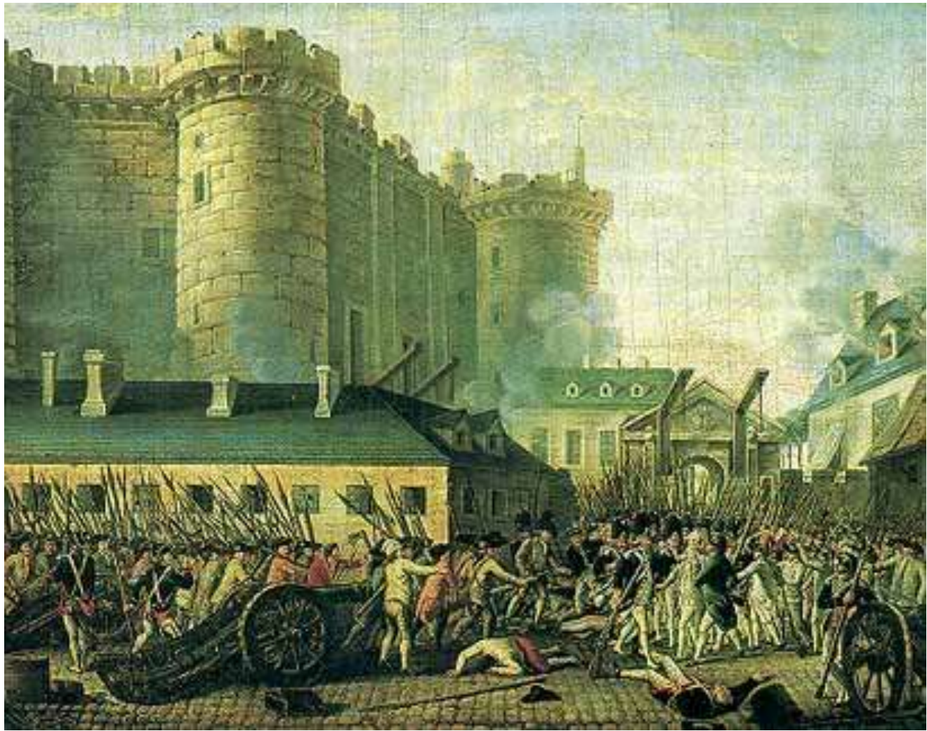
A queda da Bastilha