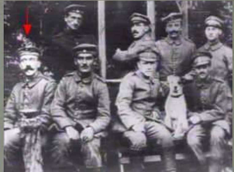
Com a seta vermelha: Adolf Hitler servindo o exército bávaro na Grande Guerra