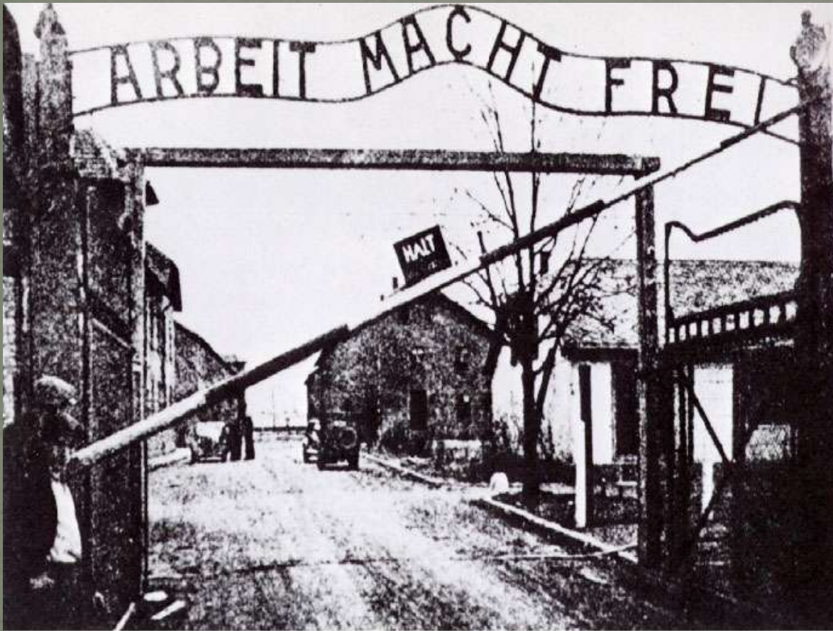
2. Auschwitz, Poland - Concentration camp opens April 1940 The message: "Work makes one free."

Perturbadora frase de entrada no campo de Auschwitz, na Polônia: