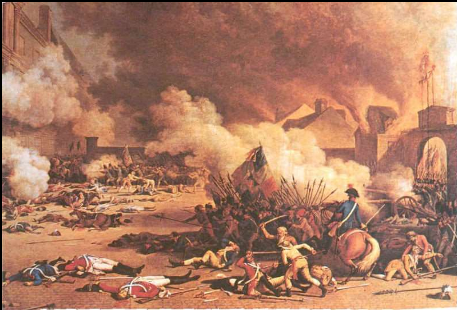
A guerra contra as nações absolutistas