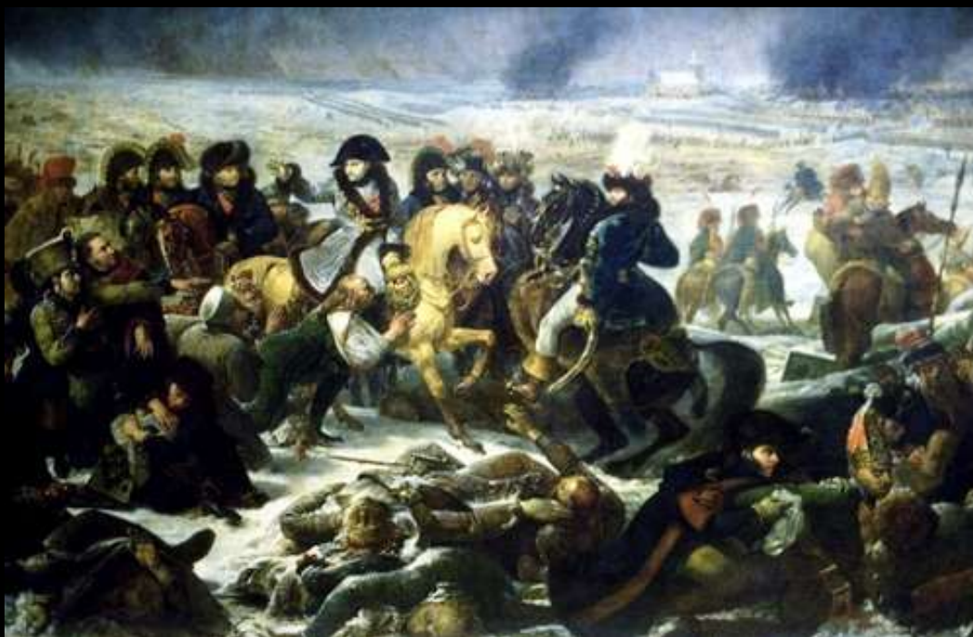
Campanha da Rússia - 1812