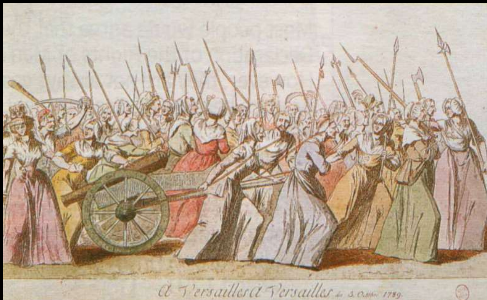
As mulheres e a Revolução