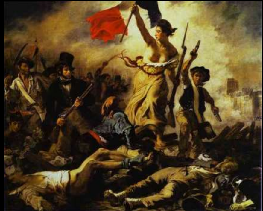
A França e seus cidadãos