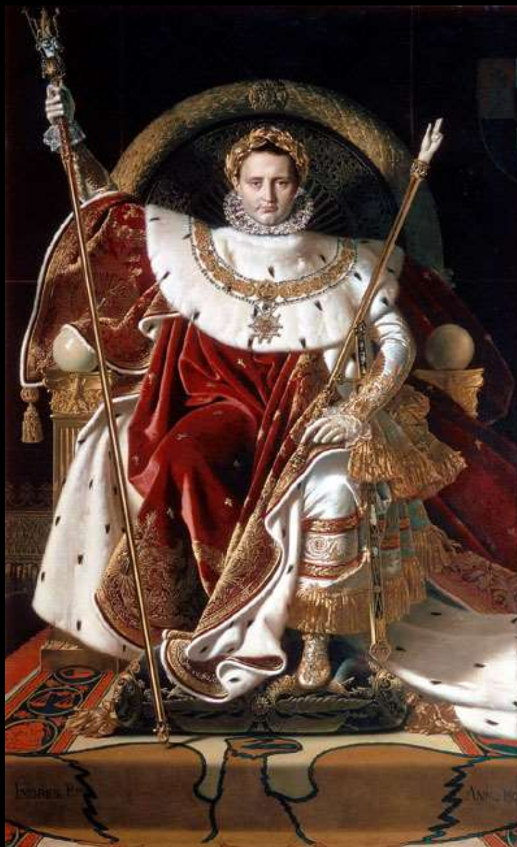
Napoleão I, o Imperador dos Franceses