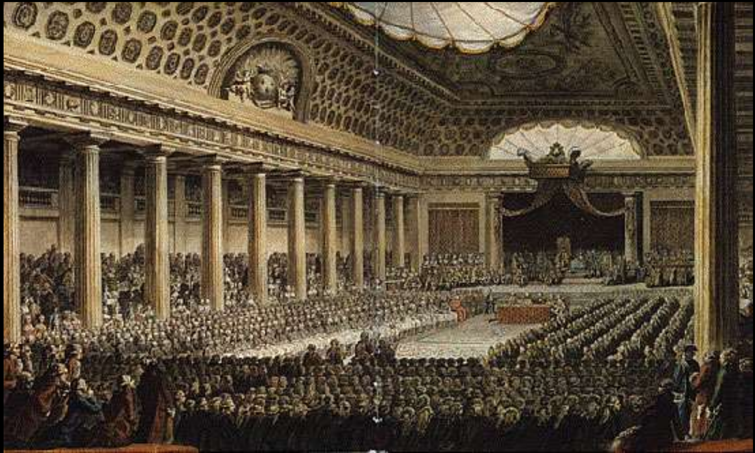
A Assembléia Nacional