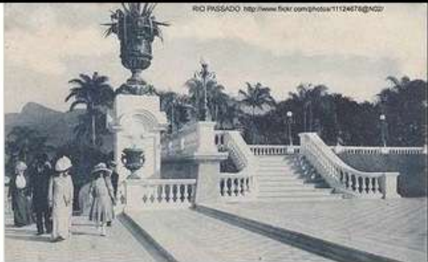
Quinta da Boa Vista