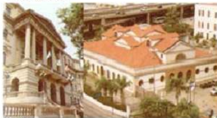
Biblioteca Nacional Casa França-Brasil