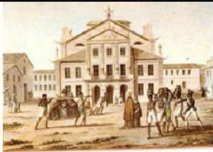
Fachada do Real Teatro São João